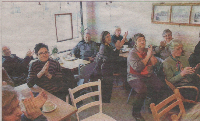
Publikum var svært begeistra over å få servert tangomusikk av høg klasse.